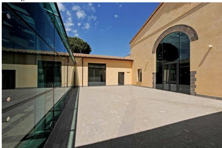
Immagine del Centro Culturale di Valle Faul

17 dicembre 2021 concessione uso gratuito dell'auditorium all'Ass. Erinna per la realizzazione dello spettacolo Tre Muse che prevede tre incontri: in questo primo evento Erinna ha preso in esame il rapporto di Dante con le donne.