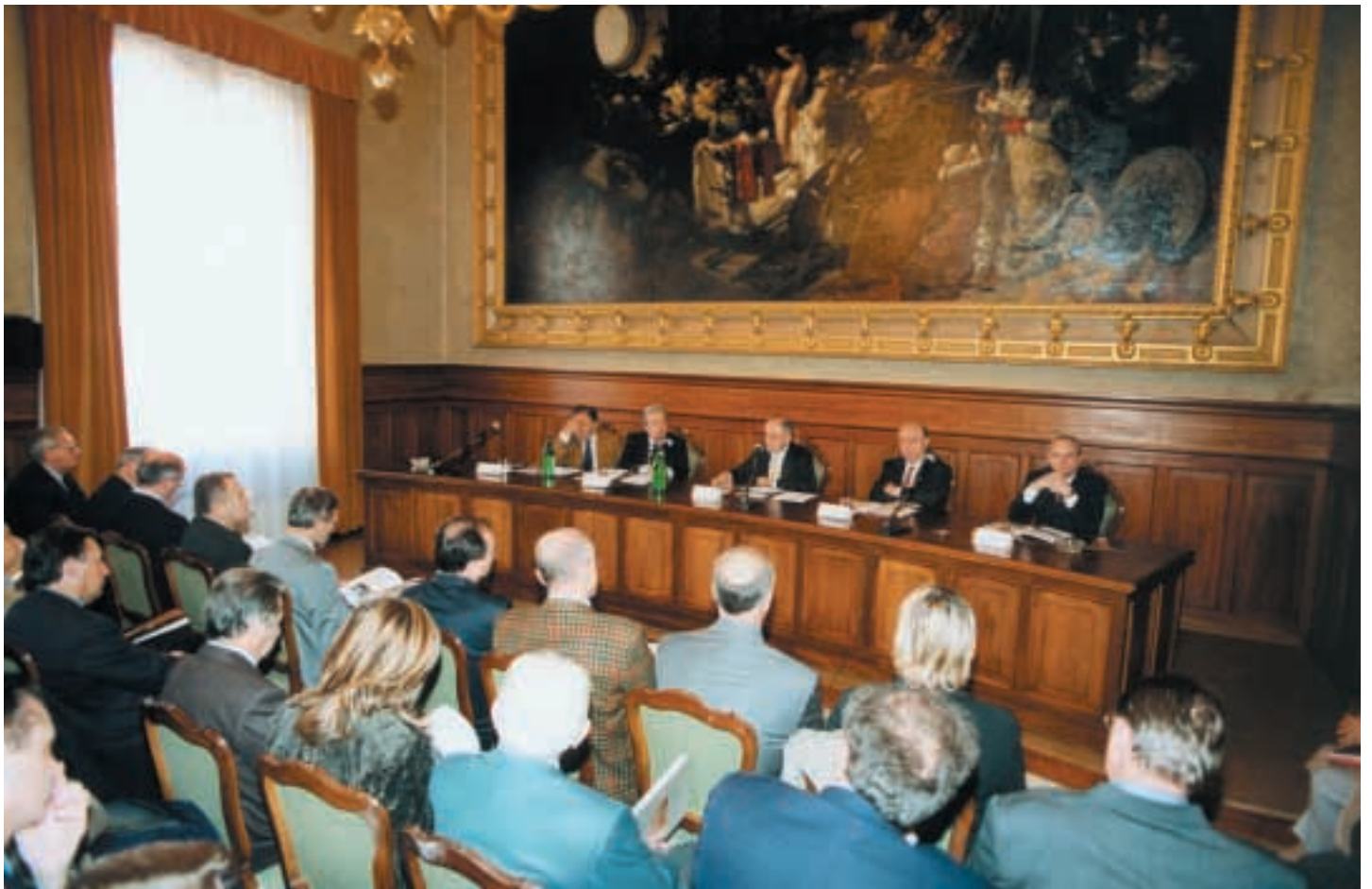
Palazzo di Residenza – Sala delle Assemblee – 16 novembre 2001 Conferenza di presentazione delle “Linee Programmatiche 2001-2002” della Fondazione