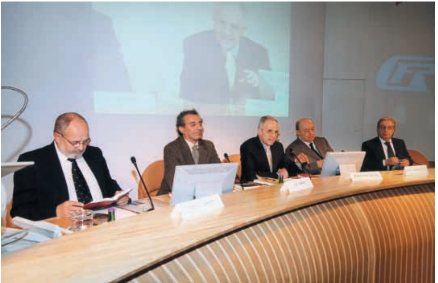
7° Ciclo "Incontri con l'Autore" organizzato dalla Fondazione Cassa dei Risparmi di Forlì Franco Cardini e Gad Lerner presentano il loro volume "Martiri e Assassini" Auditorium della Cassa dei Risparmi di Forlì Spa - 18 dicembre 2001