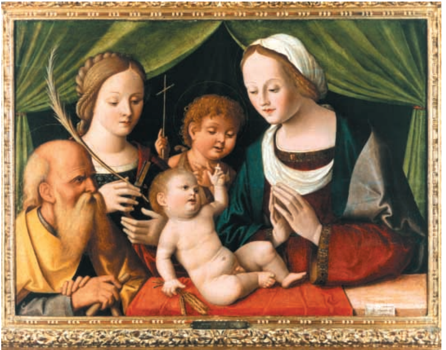
Marco Palmezzano (Forlì, 1459/63 - 1539). Dipinto di proprietà Sacra Famiglia, San Giovannino e Santa Martire (Caterina d'Alessandria?)