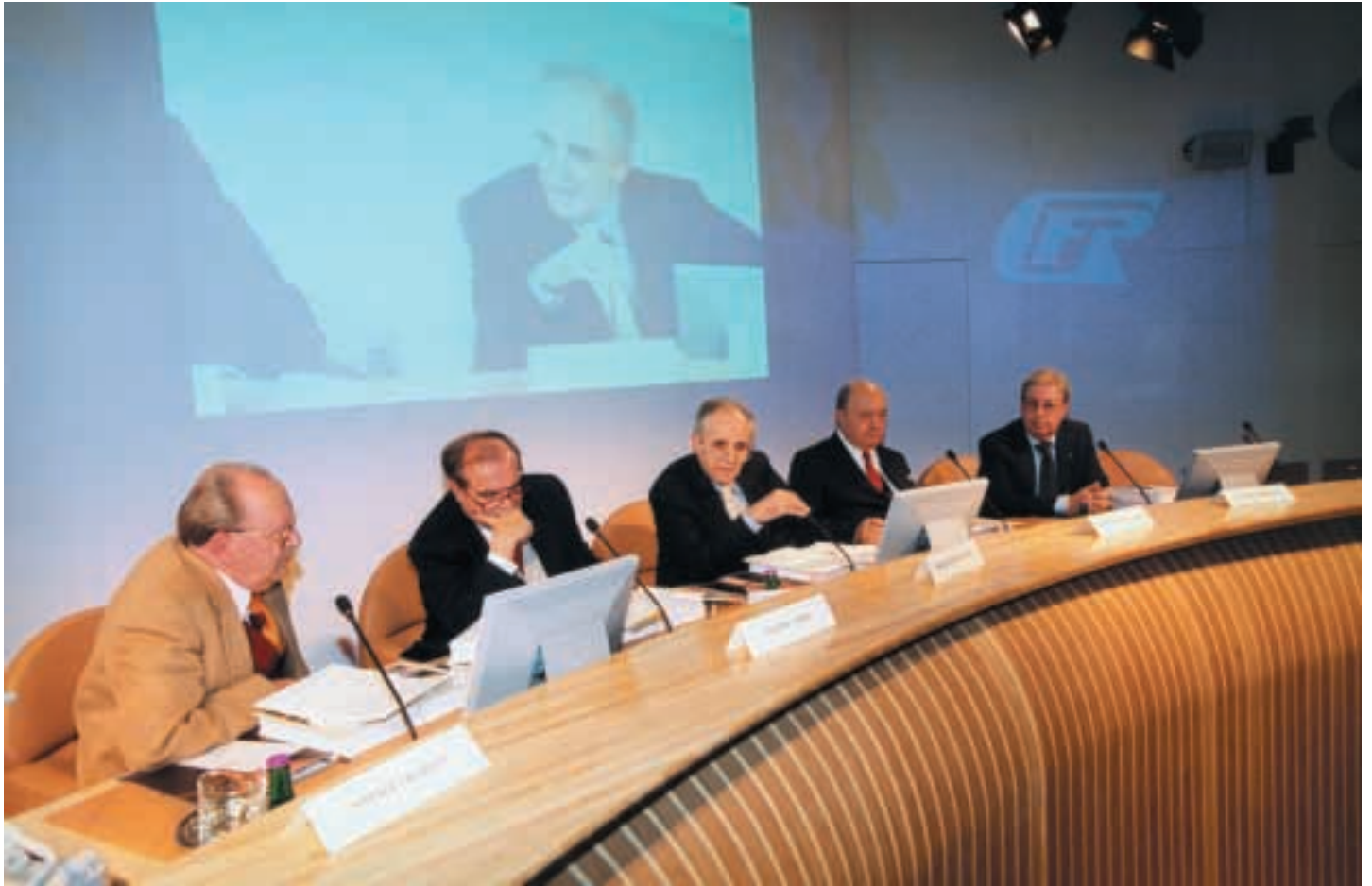
Incontro culturale organizzato dalla Fondazione Cassa dei Risparmi di Forlì Presentazione dell'opera "Romagna Toscana" – due volumi a cura di Natale Graziani promossa dall'Accademia degli Incamminati di Modigliana Auditorium della Cassa dei Risparmi di Forlì Spa – 7 dicembre 2001