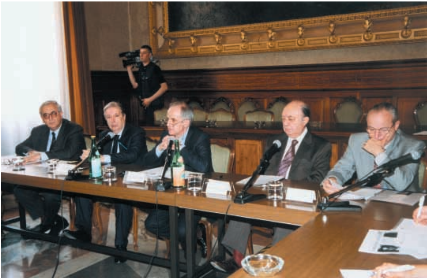
Palazzo di Residenza – Sala delle Assemblee – 27 aprile 2001 Conferenza Stampa di presentazione dei nuovi Organi Statutari e Statuto della Fondazione Cassa dei Risparmi di Forlì