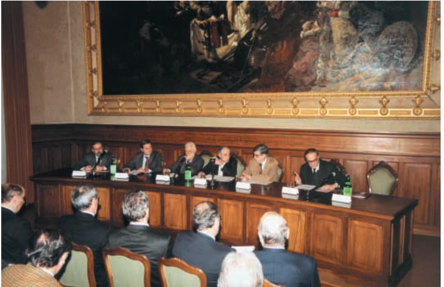
Palazzo di Residenza – Sala Assemblee – 13 dicembre 2001 Conferenza Stampa di presentazione di tre innovativi progetti della Università degli Studi di Bologna – Facoltà di Ingegneria di Forlì La Fondazione ha destinato all'iniziativa 539.000 Euro (oltre un miliardo di lire)