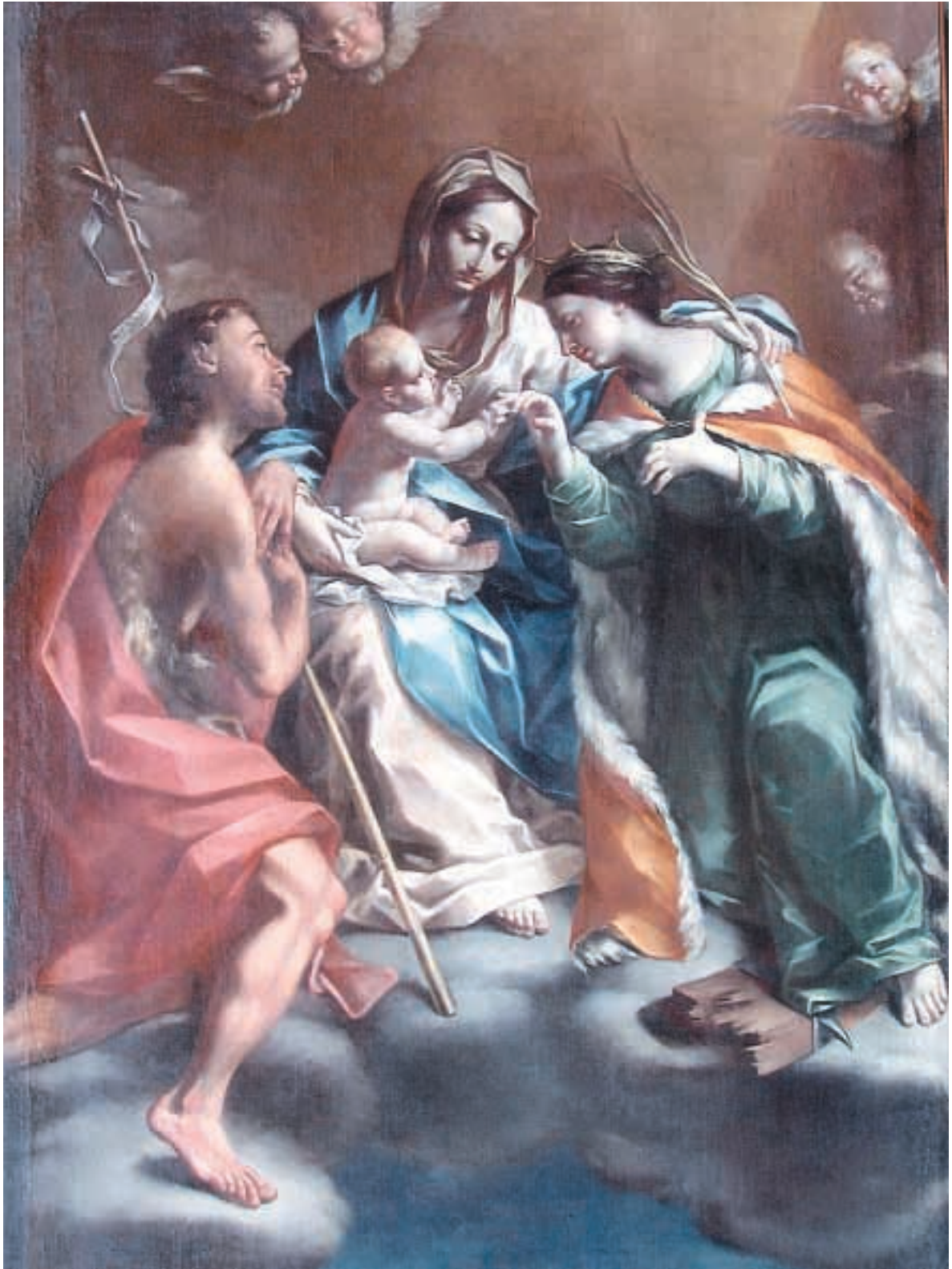
Felice Cignani (Bologna 1658 - Forlì 1724) - Olio su tela "Madonna coi santi Giovanni Battista e Santa Caterina" - Vescovado di Forlì Restaurato con il finanziamento della Fondazione